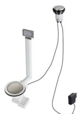
Piletta automatica Space Light - PL 8407 117