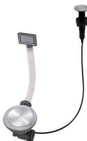
Piletta automatica Space Push - PP 8407 116