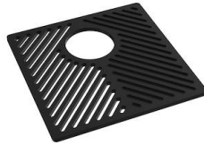
Griglia Black 8100 651